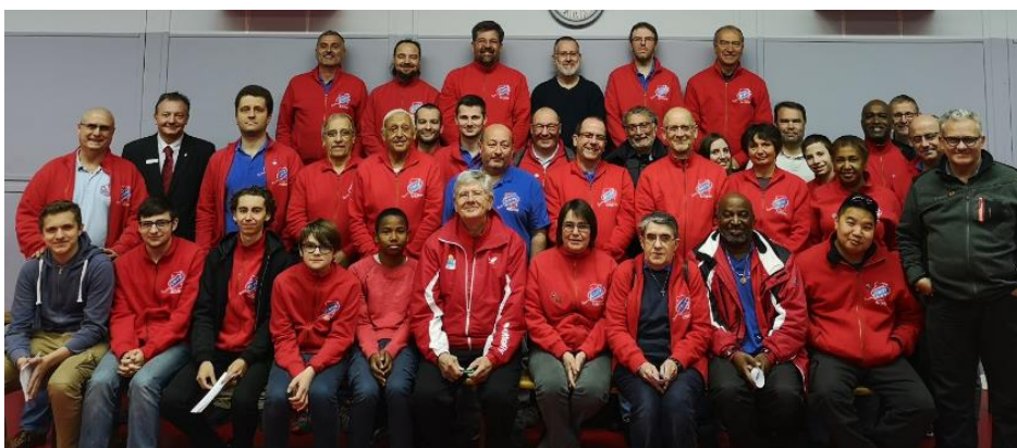
Réunion des Arbitres de l'Essonne le 5 Mai 2019 38 Participants

Il est considéré que le deuxième temps mort est toujours compris entre les échanges, il est donc autorisé.