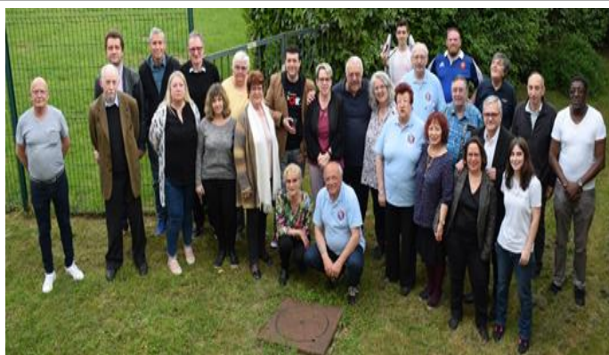
Jun 2019 : Les Unattistes d'île de France