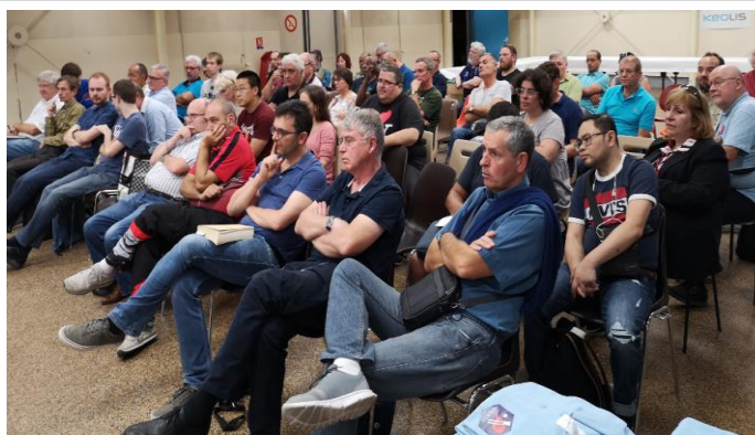
Assemblée des arbitres d'IDF Le samedi 14 septembre 2019